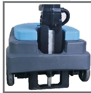
自動升降定位設計

本機設計電動推桿，可針對電扶梯的入口區或電扶梯移動踏板銜接處，通過紅外線感應調節滾刷和踏板間距，確保電扶梯進行清洗時的效果一致，適用百貨、醫院等場所。