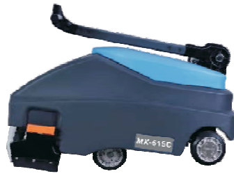
把手可摺疊收納設計