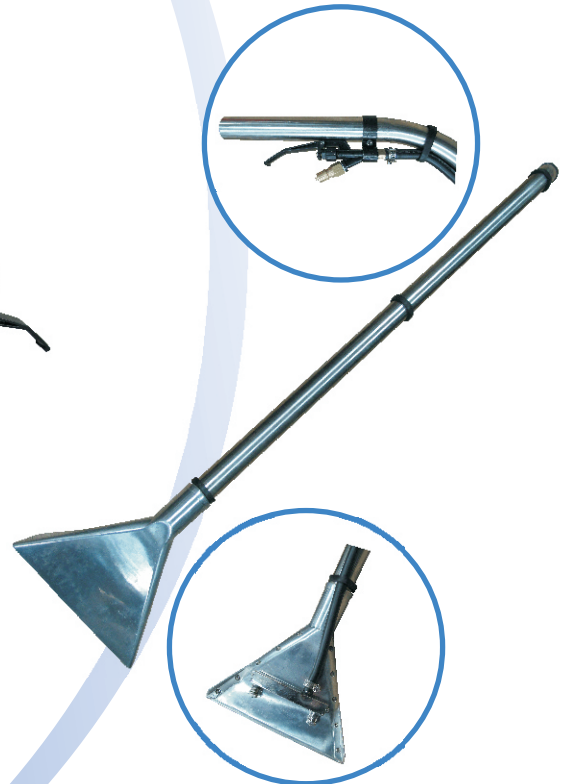
噴吸回收地鐵扒組